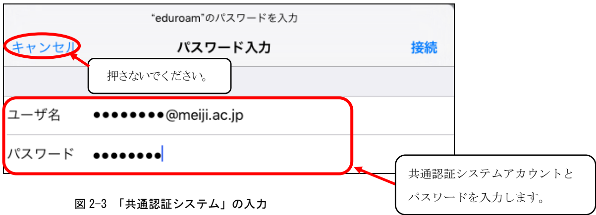
図 2-3 「共通認証システム」の入力

注) ウィンドウ左上部の「キャンセル」や「完了」は押さないでください。 押した場合は、無線接続が切断され、自動接続設定が無効化されます。