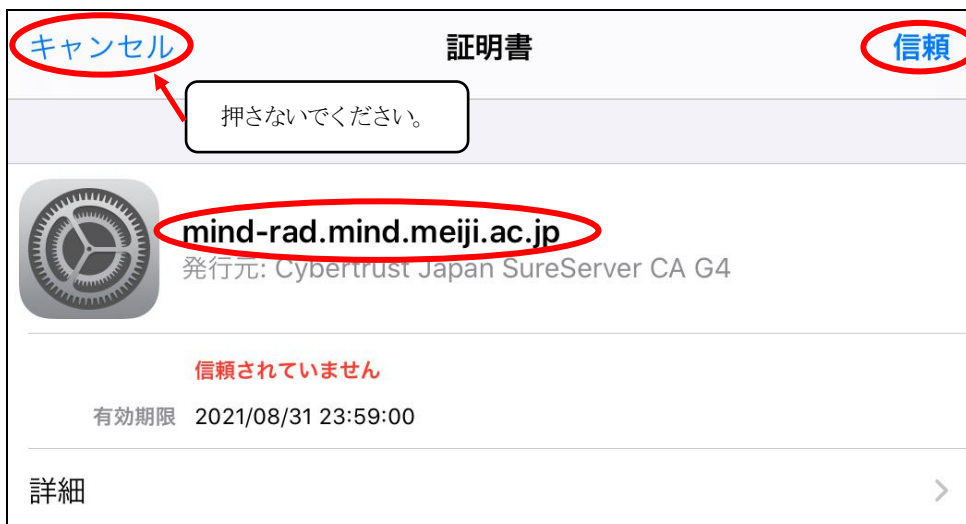
図 2-4 「証明書エラー」の表示