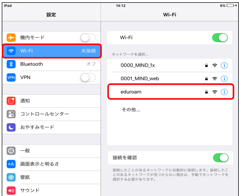
図 2-2 使用可能な無線 LAN の一覧

② 「設定」から「Wi-Fi」を選択します。「Wi-Fi」の画面から「eduroam」を選択します。(図2-2)