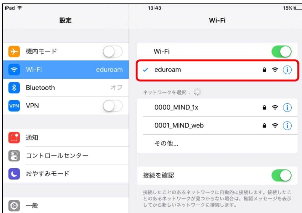
図 2-5 「eduroam」の接続状態の確認