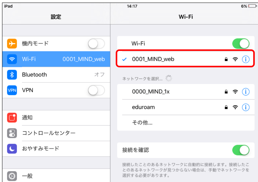
図 1-4 「0001_MIND_web」の接続状態の確認