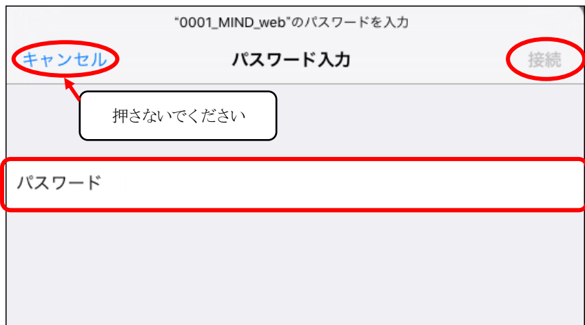
図 1-3 「0001_MIND_web」への接続

③ パスワード(暗号鍵)を入力し、[接続]をクリックします。(図1-3) 暗号鍵は[ http://www.meiji.ac.jp/mind/wireless/local/ ]に掲載されていますので 事前にご確認ください。