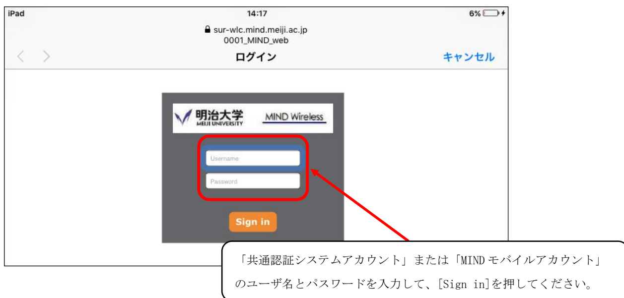
図 1-5 「共通認証システム」の入力