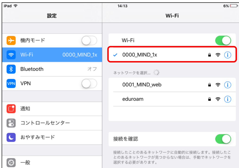
図 1-5 「0000_MIND_1x」の接続状態の確認