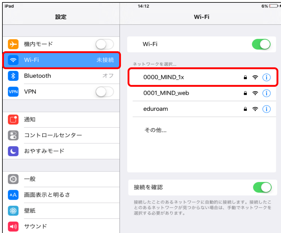
図 1-2 使用可能な無線 LAN の一覧