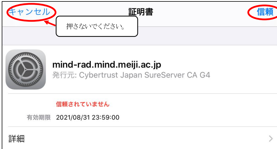
図 1-4 「証明書エラー」の表示