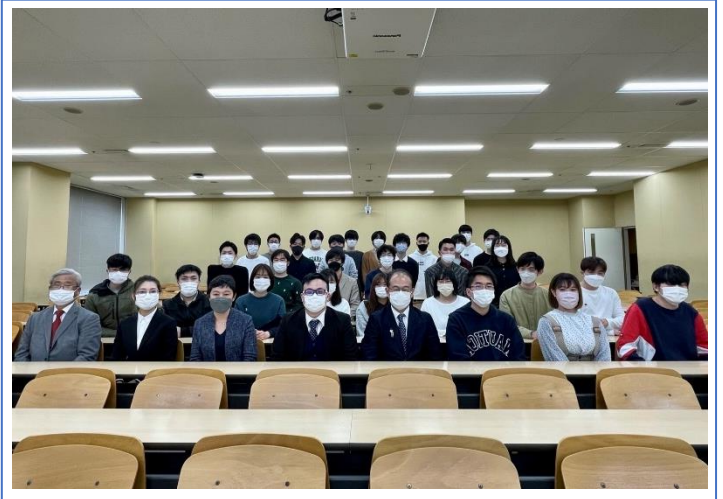
森下ゼミ集合写真