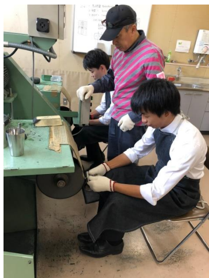
ものづくり体験の様子

10月（2021年度は11月に延期）には、新潟県燕三条地域にて行われる工場の祭典に参加します。洋食器や刃物など、金属加工が古くから有名な地域に赴き、実際に製品を製造している現場を見学します。