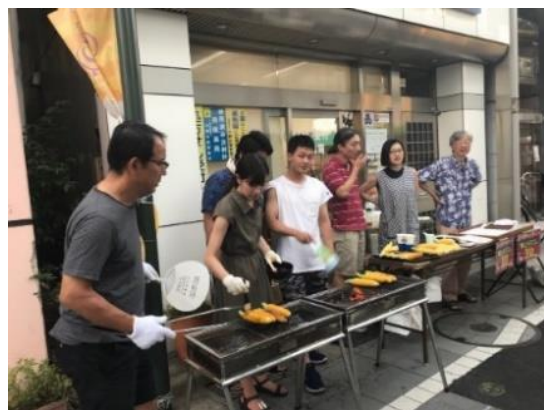
あいロードまつりの様子