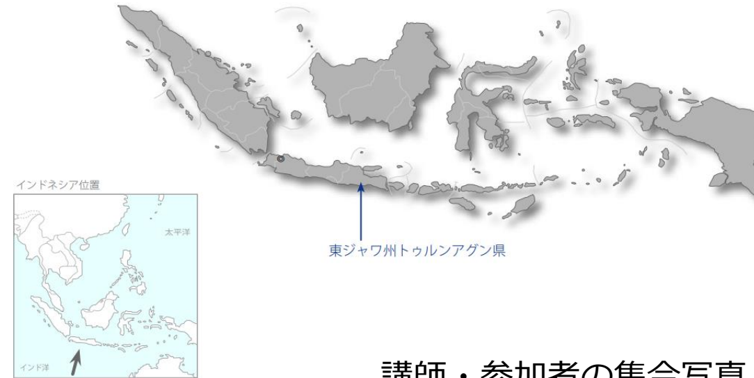
講師・参加者の集合写真