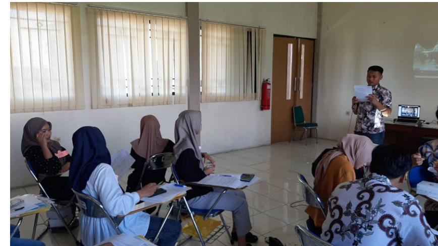
講義を受ける参加者