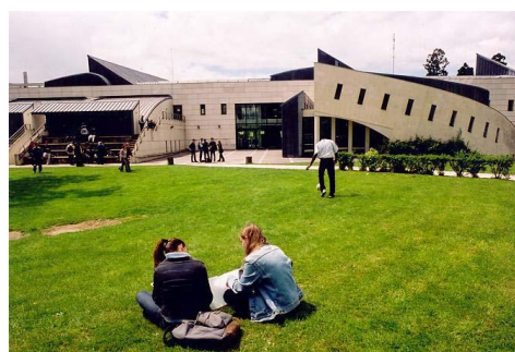
Université de Versailles Saint-Quentin-en-Yvelines にて 理学部校舎前